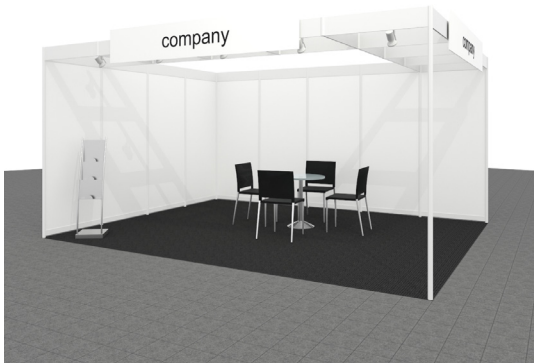
Ihr individueller Messestand